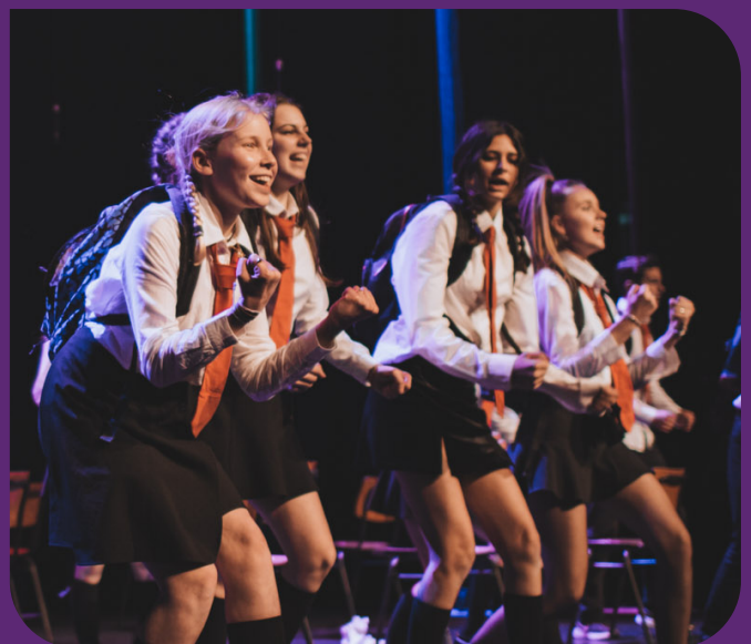
Optreden Rijswijks Jeugdtheater tijdens de finale van de Rijswijk Talent Award

Trias sloot zich aan bij de coalitie Inclusie van Gemeente Rijswijk. De samenwerking met partners uit deze coalitie heeft geleid tot de ontwikkeling van een lessenserie in het kader van inclusie en discriminatie bestrijding. In samenwerking met Welzijn Rijswijk en Stichting IdB zijn er twee workshops gegeven aan vijftig Rijswijkse leerlingen. De docent van Trias is met de leerlingen aan de slag gegaan met een hip-hop/breakdance workshop waarin de geschiedenis van de dansstijlen is besproken. De leerlingen zijn in gesprek gegaan over hun eigen achtergronden en ervaringen met inclusie en discriminatie. Daarna hebben zij met dans en lichaamsbeweging hun eigen boodschap uitgedragen. In schooljaar 2022-2023 staan er meer workshops op de planning.