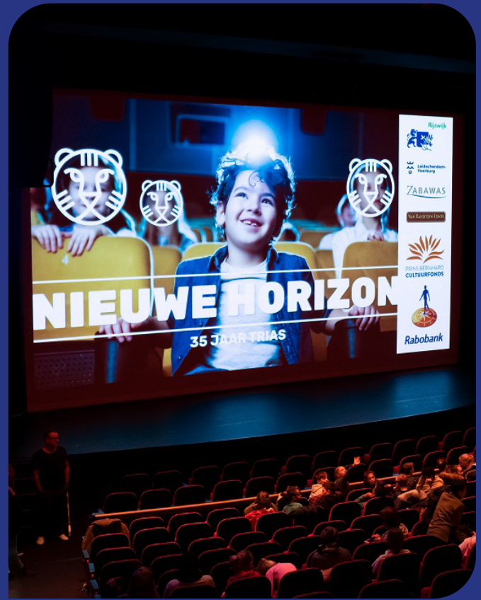
Nieuwe Horizon in de Rijswijkse Schouwburg

Helaas stond seizoen 2021-2022 nog steeds in het teken van corona. Het Trias gebouw aan de Cor Ruysstraat was in het seizoen 2021-2022 afgeplakt met pijlen voor de looproutes en op tafels stonden pompjes met desinfecterende vloeistof voor de handen. Ouders mochten nauwelijks in het gebouw en bleven buiten staan. Een schraal gezicht voor wie de gezellige sfeer in het gebouw kende van voor corona. Destijds een 'hangplek' voor kinderen en jonge gezinnen met gekraai van peuters en gezelligheid. Een informele plek waar alles door elkaar heen liep, docenten, medewerkers, leerlingen en hun ouders. Doordat mensen beducht waren om zich vanwege mogelijke lockdowns langdurig te verbinden, zagen we de deelnemers aan de jaarcursussen afnemen met dertig procent. Het aantal deelnemers aan de korte cursussen steeg met ruim dertig procent. De financiële terugval in inkomsten werd voor een deel gecompenseerd door de gemeente Rijswijk met rijks-gelden die bestemd waren voor culturele instellingen die in de problemen kwamen door corona.