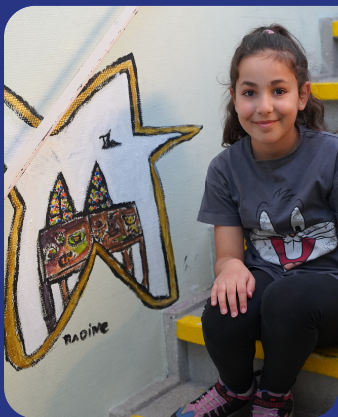
Cursisten namen afscheid van het gebouw aan de Cor Ruysstraat door mooie muurschilderingen

De nieuwe horizon van Trias ziet er veelbelovend uit; een sterk en professioneel team, een mooie locatie, een groeiende belangstelling voor onze activiteiten in de vrije tijd en in het onderwijs en veel kansen op het gebied van 'laagdrempelige cultuurparticipatie' in samenwerking met onze partners in en rondom het Huis van de stad. We kijken vol verwachting naar de toekomst.