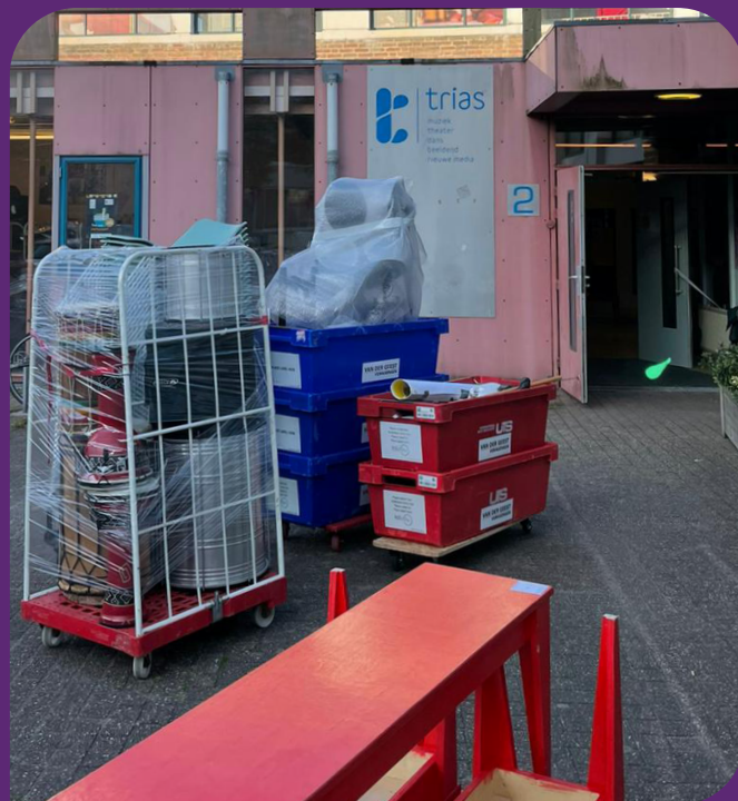
Trias aan de Cor Ruysstraat tijdens de verhuizing

In het kader van 'Tijdelijke steun COVID-19 lokale culturele voorzieningen' (rijksgeld) ontving Trias ook incidentele subsidie van de gemeente Rijswijk genaamd 'transformatiesteun'. We hebben deze steun in 2021-2022 ingezet om acht touchscreens, vier AV schermen en een livestream set voor onze lesruimtes in het Huis van de stad Rijswijk te kopen. De touchscreens in de muzieklokalen zijn voorzien van een