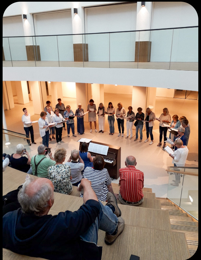
Presentatie aan het einde van het seizoen met Van Bach tot Beatles koor in het atrium van het Huis van de stad Rijswijk