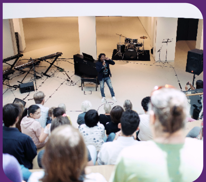
1. Huis van de stad Rijswijk – aanzicht vijverzijde 2. Drukbezochte open dag van Trias met optredens