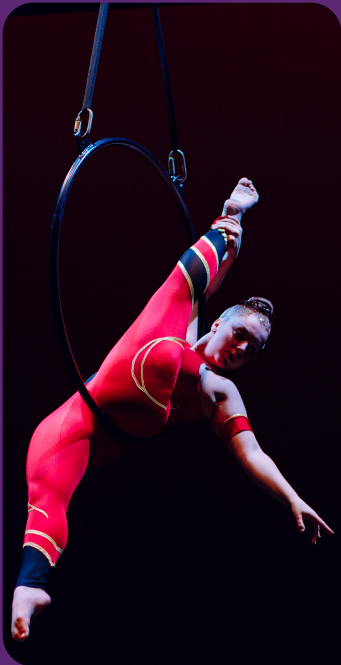
Acrobatiek tijdens de finale van de Rijswijk Talent Award