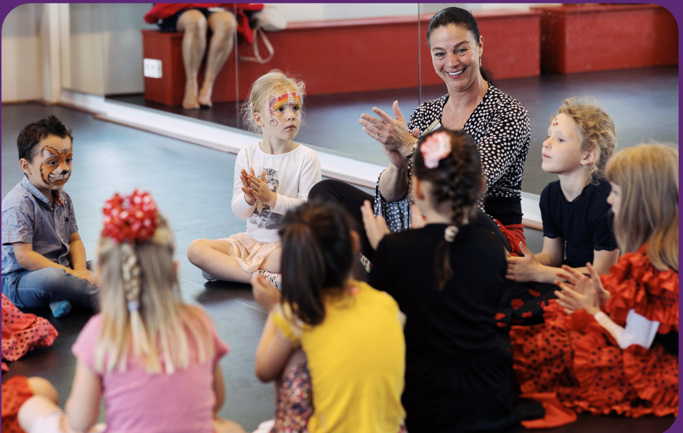
Proefles Flamenco Dans door Liz Dans Flamenco tijdens de open dag van Trias