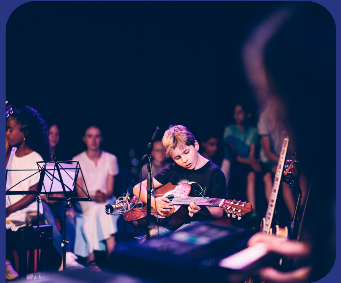
Optreden van een band tijdens Trias Music Fest in de herfstvakantie