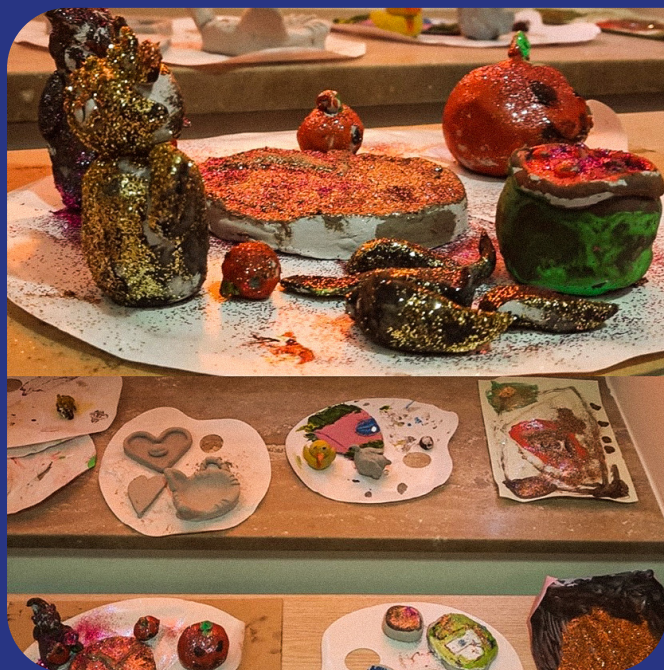
Kunstwerken gemaakt door Oekraïense kinderen in het Atelier van Trias