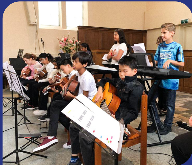
Optreden tijdens het Huygens Muziekfestival 2021 met het jeugdorkest van de Wijkmuziekschool

docent heeft in plaats daarvan een video opgenomen voor de cursisten. In de week na de kerstvakantie zijn de lessen online gegeven via zoom. Daarna mochten de lessen weer live op locatie plaatsvinden voor de rest van het seizoen. In juni konden de eindvoorstellingen weer live in het theater gespeeld worden voor publiek. Dit was een groot succes! De korte cursussen musical (5-7 jaar) en theater (7-12 jaar) zijn allemaal gestart met gemiddeld tien kinderen per groep. Een enorme stijging ten opzichte van vorig seizoen. Bij de Jeugdtheaterschool hebben we ook kennismakingscursussen en vakantieactiviteiten aangeboden. Er hebben 100 cursisten meegedaan aan een korte cursus, kennismakingscursus of vakantieactiviteit. In totaal hebben 182 cursisten een cursus of activiteit gevolgd bij de Jeugdtheaterschool.