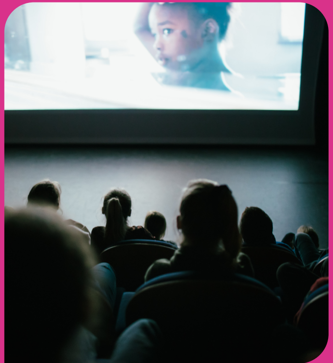
Nieuwe Horizon in Theater Ludens

In de lessenreeks Beeldmakers ontwerpen en creëren leerlingen uit groep 8 hun eigen beeld en krijgen ze de tools om een expositie van hun kunstwerken te organiseren. De lessenreeks bestaat uit drie lessen: leerlingen en de leerkracht bezoeken een kunstwerk in de buurt van de school; leerlingen ontwerpen en maken met behulp van een beeldende vakdocent van Trias hun eigen beelden.