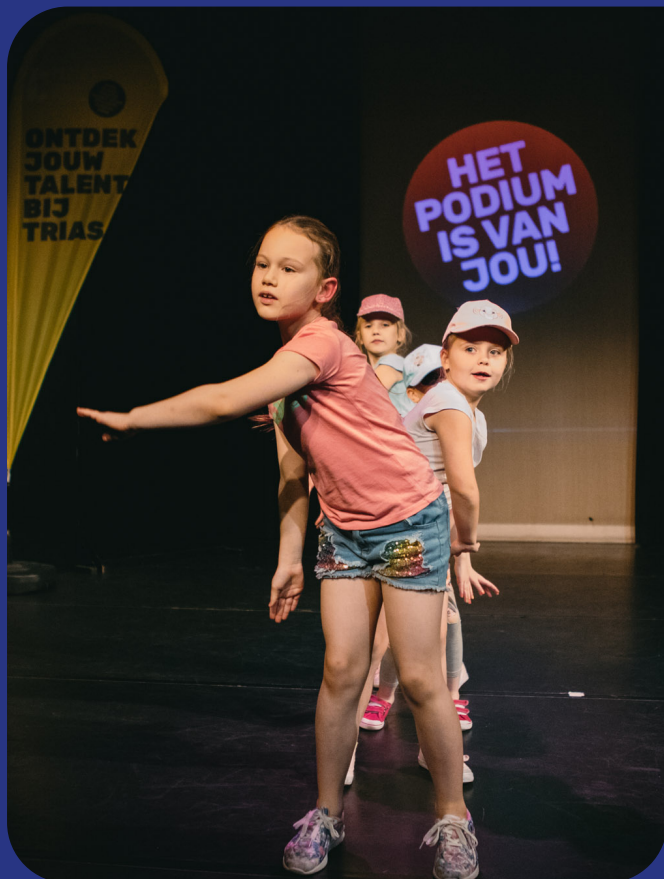
Dansoptreden tijdens Open Podium op 26 november 2021

De laatste lockdown was afgelopen op 25 februari 2022. Daarna begon meteen de uitvoering van de verhuizing. Al in seizoen 2021-2022 zagen we een voorzichtig begin van herstel van de coronaschade. Meer ouders durfden hun kind in te schrijven voor een korte cursus of jaarcursus. De eerste open dag in het Huis van de stad op 11 juni 2022 was een daverend succes en leidde ook tot inschrijvingen ter plekke. Hoopgevend voor het seizoen erna. Omdat er vanwege de coronamaatregelen en de verhuizing tijdens de meivakantie 2022 een grote druk lag op het hele team van Trias, was vooraf besloten om in de zomervakantie van 2022 geen vakantieactiviteiten te organiseren. Het seizoen werd afgesloten met goed bezochte kennismakingscursussen, een laagdrempelige manier om nieuwe cursisten te werven. 14