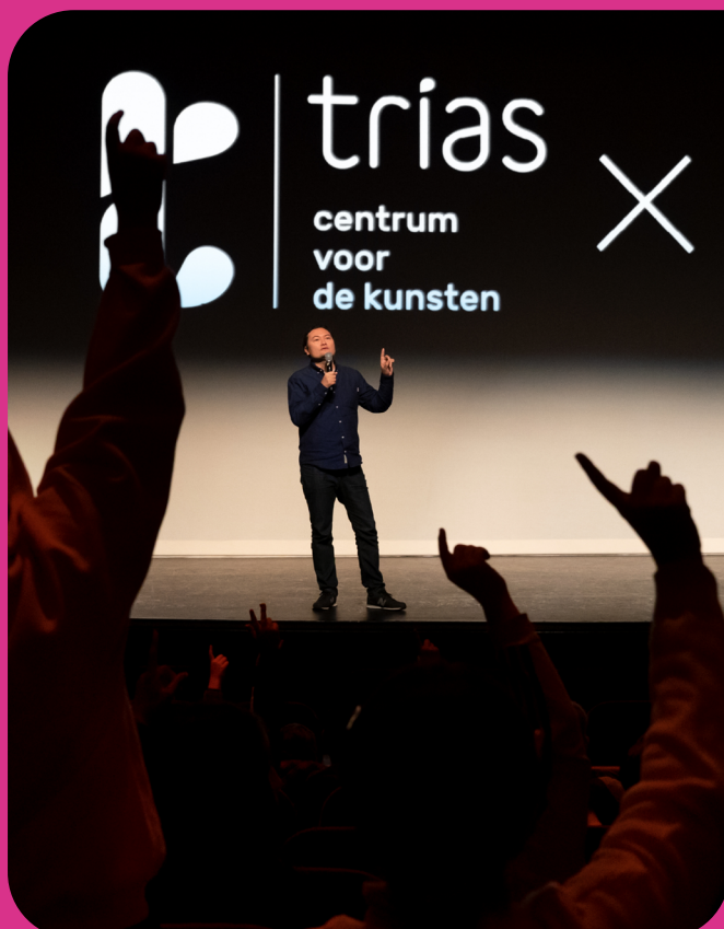
Nieuwe Horizon in de Rijswijkse Schouwburg