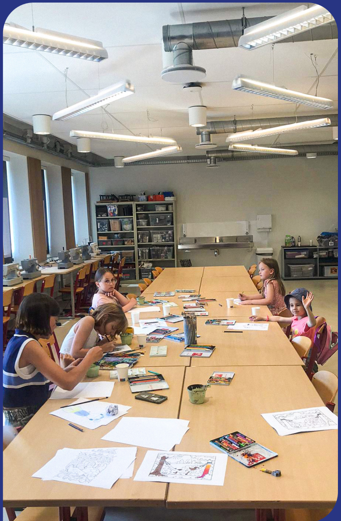
Kunstklas met Oekraïense kinderen in het Atelier van Trias

Vanuit het Kornuiten fonds is er in cursusseizoen 2021-2022 een nieuwe samenwerking tot stand gekomen met KDC Aandachtslab in Rijswijk. Hierbij hebben zes meervoudig beperkte kinderen ieder zes muziektherapie sessies gekregen van de harpdocente. Een intensieve voorbereiding heeft als resultaat gehad dat elk kind de muzieksessie heeft ontvangen die bij hem/haar past met als gevolg zes vrolijke maar ook ontspannen kinderen na elke sessie.